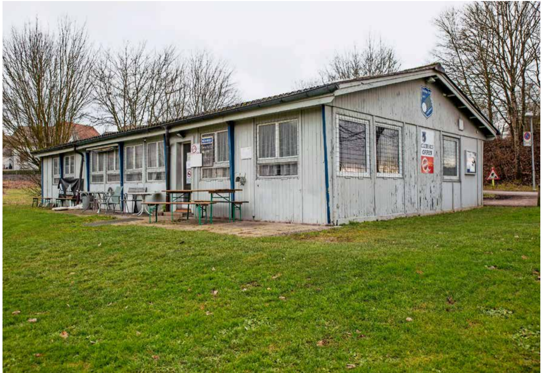
Wo heute das Clubhaus des Sporting Clubs steht, ist das neue Garderobengebäude mit Mehrzweckraum geplant.

Im Grossen Stadtrat war die Aufwertung der Anlage an sich unbestritten – lange Diskussionen gab es trotzdem, insbesondere zur Bauweise des Garderobengebäudes. Ursprünglich hatte der Stadtrat einen Holzbau vorgeschlagen. Damit waren die Bürgerlichen aber nicht einverstanden. Sie gaben zu bedenken, eine Holzkonstruktion