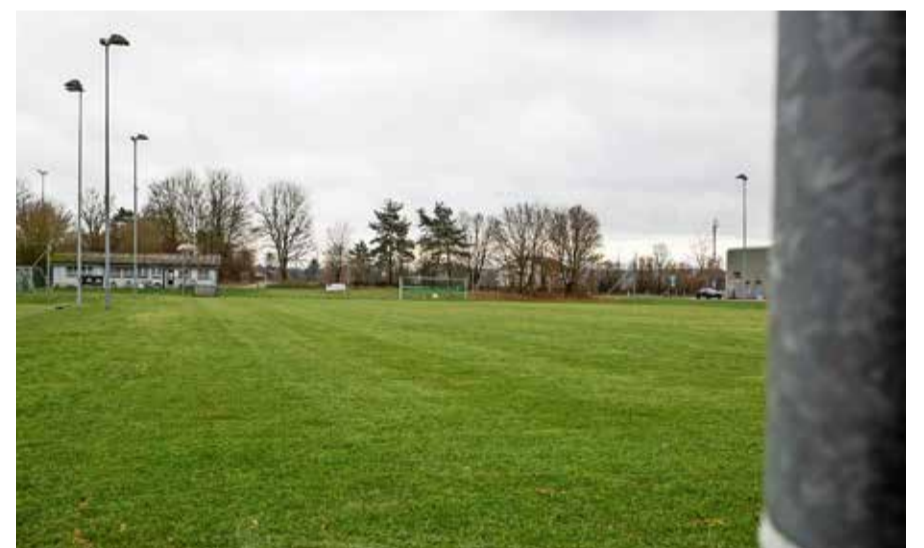
Aus dem Naturrasenplatz II direkt beim Nationalen Handball- und Trainingszentrum (rechts) wird ein Fussballfeld mit Kunstrasen.

Sagen die Stimmbürgerinnen und Stimmbürger Ja zur Aufwertung, soll diese etappenweise erfolgen und innert drei Jahren abgeschlossen sein.